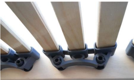
federnde Trio Kappen aus Kautschuk

Der Lattenrost Federlux KF (Kopf- und Fußteil verstellbar) ist die neueste Innovation aus dem Hause FMP Matratzenmanufaktur. Er besticht durch seine geringe Bauhöhe von nur 5 Zentimetern und besitzt dennoch 42 Federholzleisten. Die individuell einstellbare Beckenkomfortzone bietet hohen Komfort. Sie verstärkt die Eigenschaften einer 7 Zonen Matratze.