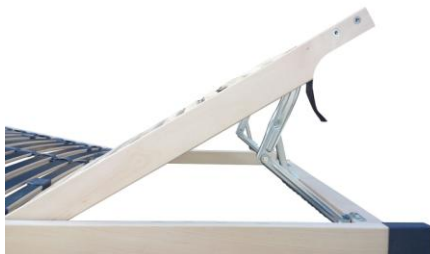
Kopfteil mit hochwertigen Verstellern

der Niedrige mit 42 Federholzleisten, Kopf- und Fußteil verstellbar